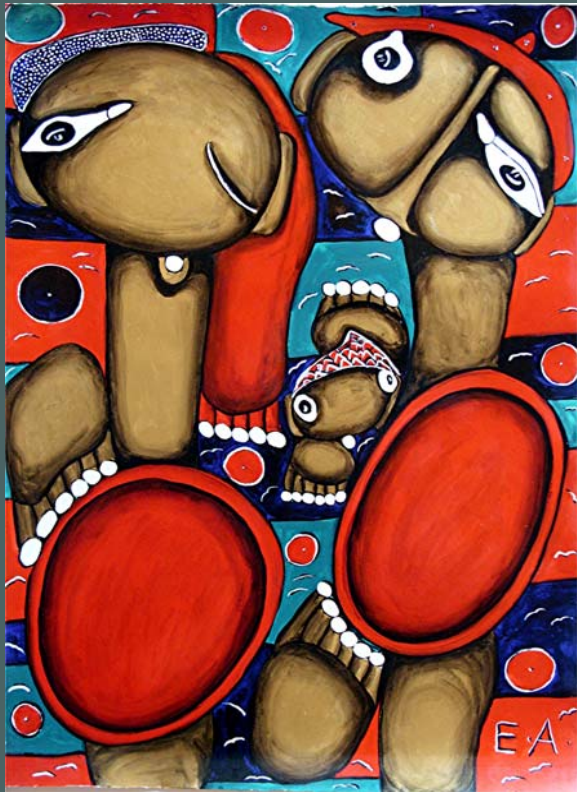
DIE ZWEI MIT SCHILDEN UND INSEKTEN, 2000, Acryl auf Papier, 108 x 80 cm