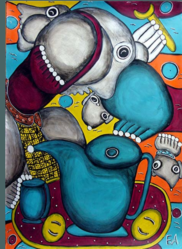
DAS FRÜHSTÜCK, 1995, Acryl auf Papier, 108 x 80 cm