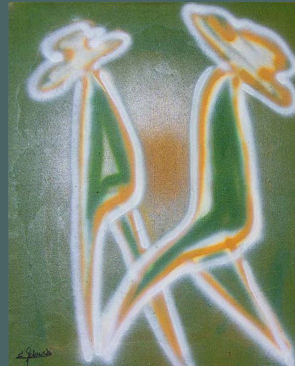
alle Abbildungen: Graffiti auf Leinwand