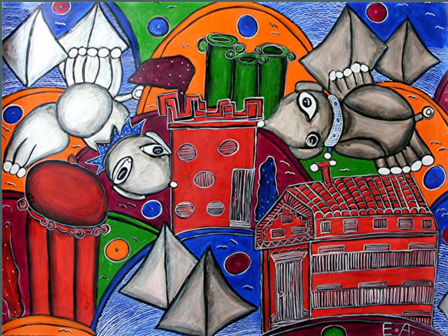
DER SÜDEN, 1995, Acryl auf Papier, 80 x 108 cm