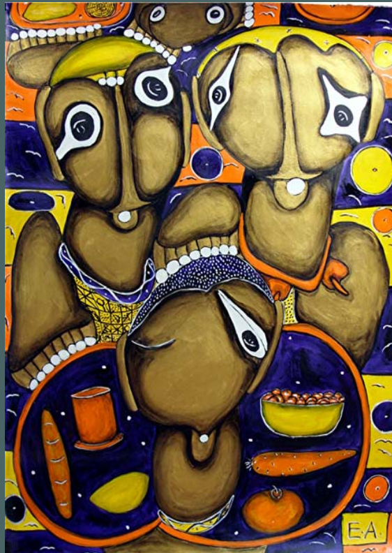
DIE FAMILIE, 2000, Acryl auf Papier, 108 x 80 cm