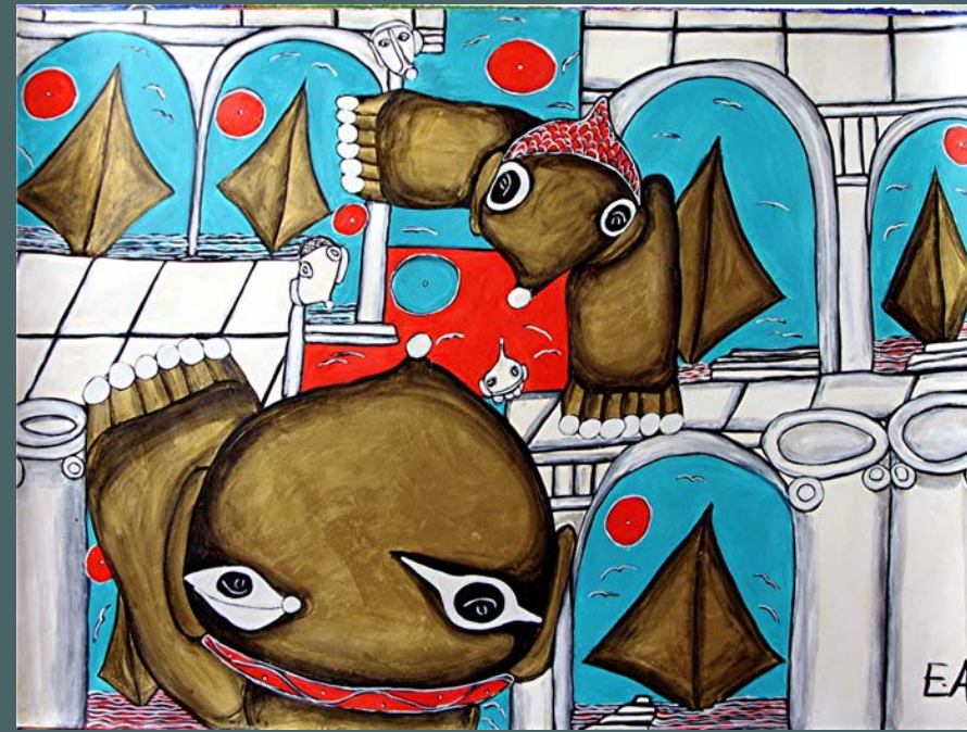
VILLEN AM MEER, 1999, Acryl auf Papier, 80 x 108 cm