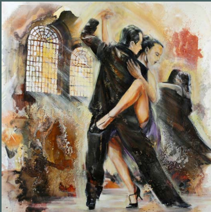
links: Tango, 2011, 110 x 110 cm, Mischtechnik auf Nessel-Canvas, 950,00 € rechts: Ballroom, 2010, 110 x 110 cm, Mischtechnik auf Nessel-Canvas, 950,00 €