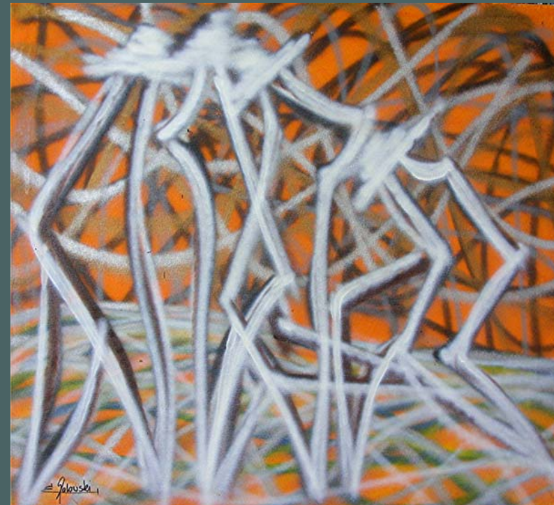
Graffiti auf Leinwand