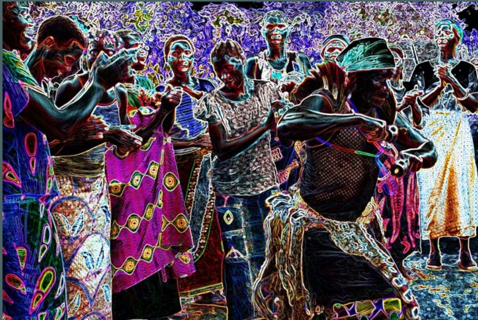
links: ICH RUFE DIE GEISTER DER AHNEN

Dieter Klaas ist ständig auf der Suche nach neuen Möglichkeiten, das Gesehene, seine mit der Kamera festgehaltenen Momentaufnahmen zu hinterfragen, zu ergründen, neu zu deuten. Seit 2007 arbeitet der Fotograf vermehrt künstlerisch experimentell mit Hilfe des Computerpaintings. Er ist ein kritisch exakter Beobachter - egal ob es um die künstlerische Fotografie oder um die tägliche Arbeit, seine Industrie- und Werbefotografie geht - immer bringt er sich selbst voll ein, um das Maximale zu erreichen.