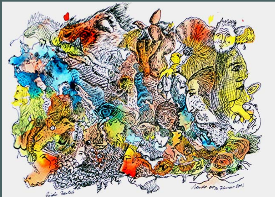
OHNE TITEL, Federzeichnung auf Aquarell, 36 x 48 cm, 20. Feb. 2006